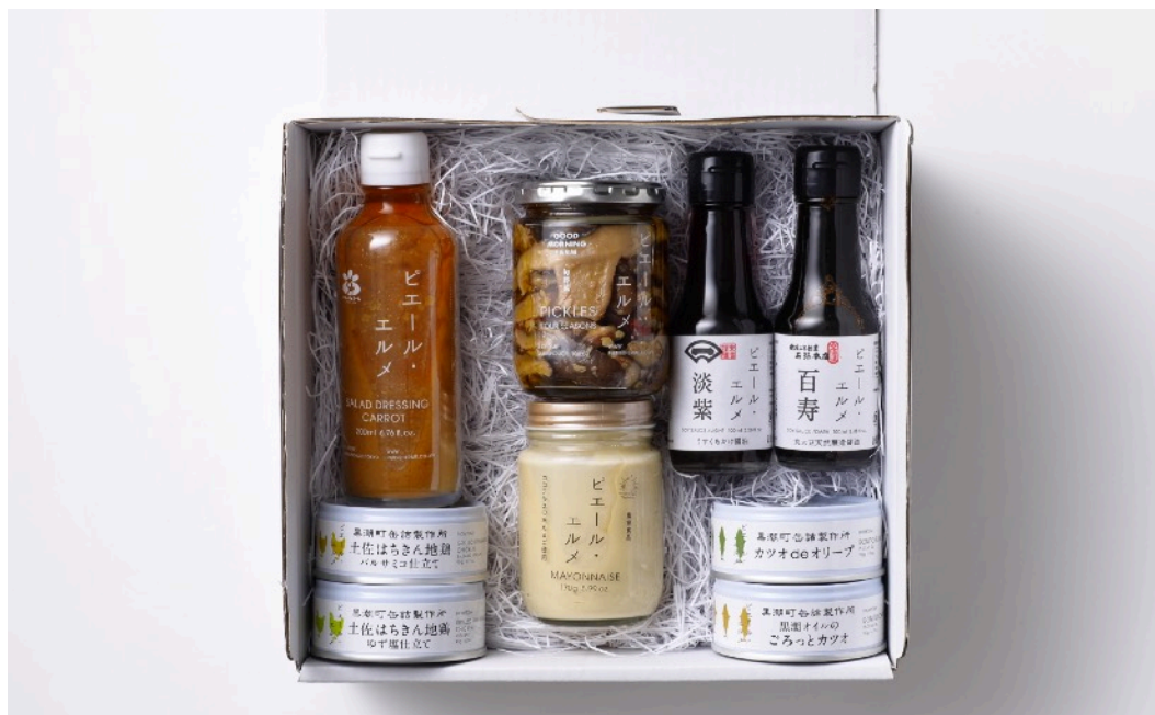
グロサリーギフトセット (大)