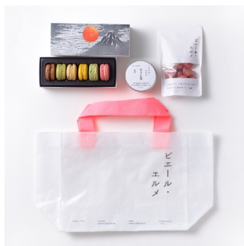
スイーツギフトセット

食卓に出すだけで様になる「ピクルス 愛媛ミックス」や、トマトの旨味が凝縮された「トマトドレッシング」、おつまみやいつもの料理のアクセントとして活用できる「缶詰 土佐はちきん地鶏 ゆず塩仕立て」、米麴由来のまろやかな甘みをもち、「つけ醤油」「かけ醤油」としてあらゆる料理にお使いいただける「淡口醤油 淡紫」をギフトボックスに詰め合わせました。