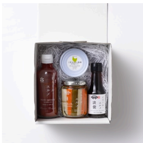
グロサリーギフトセット (小) ¥3,696

『Made in ピエール・エルメ』の人気プロダクトを余すことなくセレクト。そのままでもパスタなどにアレンジしても美味しくお召し上がりいただける「しいたけオイル煮」と、愛知県常滑市の米たまごを使った「たまご農家のこだわりマヨネーズ」、天然醸造醤油「淡口醤油 淡紫」「濃口醤油 百寿」、高知県の名産物を使った「缶詰」4種、高知県産の人参と玉ねぎをたっぷり使用した「キャロットドレッシング」をギフトボックスに詰め合わせました。