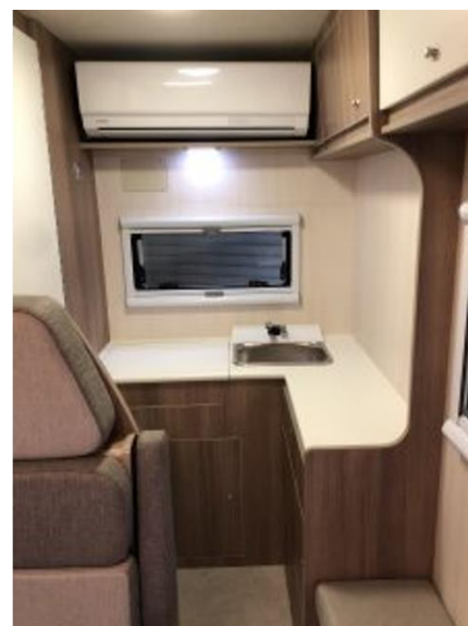
4 位 Puppy480（キャンパー厚木）の外観と装備するエアコン