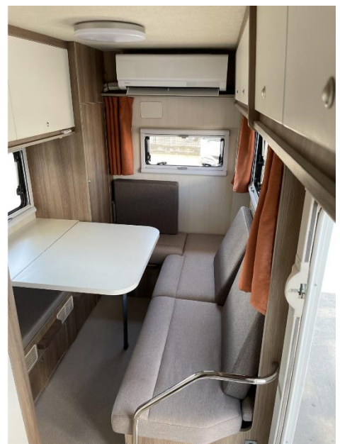
2 位 Puppy Fullhouse（キャンパー厚木）の外観と装備するエアコン

ここ数年サブバッテリーの大容量化により、キャンピングカーにはエアコンは必須として検討されている方が増えています。