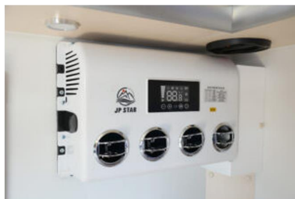
1 位 Puppy480（JP STAR）の外観とオプション装備のエアコン

最新の総合ランキングはこちら https://japan-crc.com/ccn/viewrank/