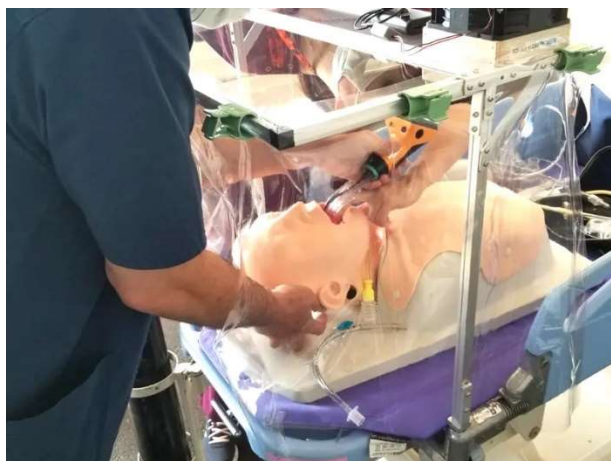
ストレッチャー用飛沫防止フード

実際、コロナ禍では感染防止対策としてパーティションを提供した地元の医療機関から、医療従事者の感染対策について相談を受けたことで、ストレッチャー用飛沫防止フードや車椅子用飛沫防止カバーといった新たな商品を世に出してきました。自社のアイデア・技術力を知っていただくことで、さまざまなシーンで起こる困りごとをまずご相談いただける存在になりたいと思います。