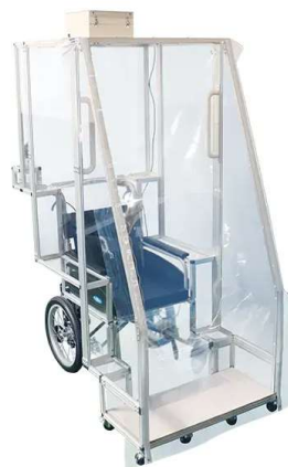
車椅子用飛沫防止カバー