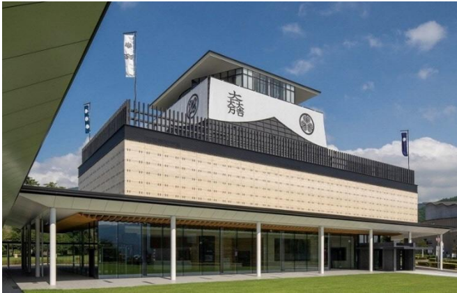
<岐阜関ヶ原古戦場記念館 外観>

W E B : https://sekigahara.pref.gifu.lg.jp/