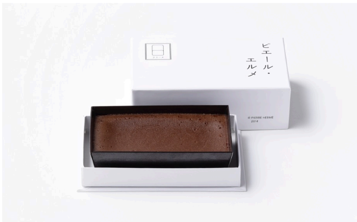
チョコレートケーキ 3,240円

チョコレートを贅沢に使った濃厚なケーキ。隠し味に厳選した北海道産のこしあんを使用することで、なめらかでしっとりとした口当たりをお楽しみいただけます。2022年のバレンタインで期間限定販売した好評だったチョコレートケーキを、サイズとパッケージを変えて通年販売します。