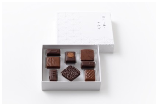
チョコレート8個詰合わせ 4,320円