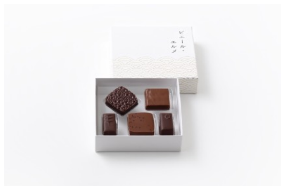
チョコレート 5個詰合わせ 2,700円

夏の贈り物にもぴったりのチョコレート詰合わせもラインナップ。独特の輝き、まろやかさ、芳香を持つチョコレートは、カリッとした食感の妙と、口の中でソフトにとろける至福の味わいで、夏の熱気と喧騒から解放されたひと時をお過ごしいただけます。