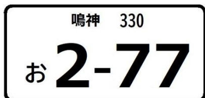
ナンバープレート末尾77の例