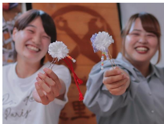
▲友達と一緒に思い出を作ろう！