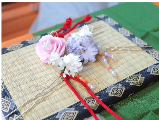
▲忍里限定の「かんざし」

鮮やかな花で彩られる秋の淡路島で、自分好みの素敵な簪を創ってみませんか？ 家族や友達、大切な方と一緒に思い出に残るクラフト体験をお楽しみください！