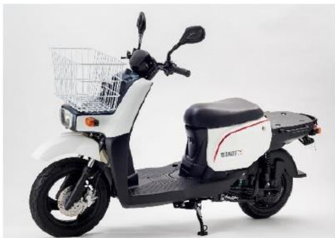
業務用電動バイク『BIZMO II-S（ビズモツーエス）』

当社が製造販売する業務用電動バイク『BIZMO II-S』は、100%電気で走る業務用の原付電動バイクで、国内トップクラスとなる 1 回の充電で約 150km の走行が可能です。また、プラグ交換、エアフィルター交換、チェーン交換、クラッチ交換、エンジンオイル交換など、ガソリンバイクに必要なメンテナンスは不要になるうえ、エンジンが止まる・エンジンがかからないなど、ガソリンバイクに多い燃焼系トラブルも起きません。さらにガソリン給油の手間が不要で、100km 走行するための電気代は約 66 円と工