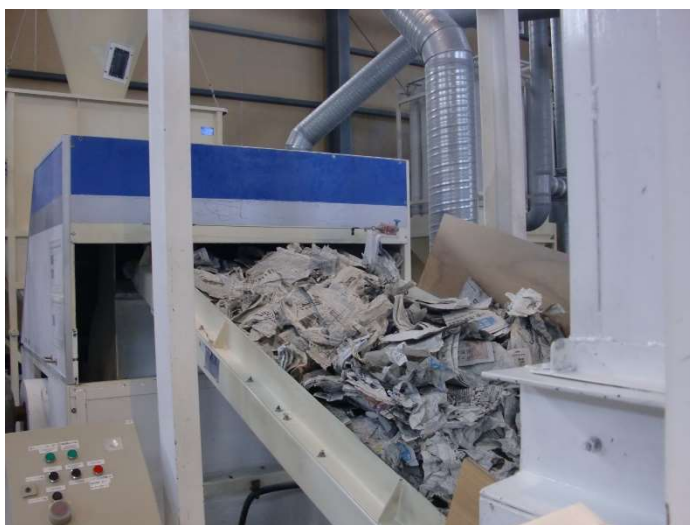
デコスファイバーの主原料である新聞紙

また、 デコスファイバーは冬の室内の乾燥も防ぐことができます。 夏同様、新聞紙（パルプ）の性質で湿度を調整するため、乾燥した室内の空気に対し、湿気を放出するため、デコスファイバーを施工した住宅では、国内で一般的に使用されているグラスウールを施工した住宅と比較して、冬の湿度が 5%ほど高いという結果も出ています。年間を通じて湿度変動が緩やかにする効果があります。