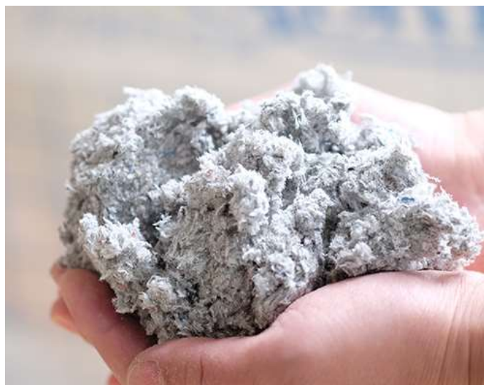
環境性能も高いデコスファイバー

デコスファイバーは、新聞紙を主原料とする綿状の木質繊維系断熱材「セルローズファイバー断熱材」です。セルローズファイバー断熱材は、粉碎した新聞紙にホウ酸・ホウ砂、はっ水材を加えて混ぜて作られ、断熱性だけでなく、調湿性・吸音性・防火性などにも優れているのが特長です。石油燃料を使用せず、電気エネルギーのみを用いて製造され、 他の断熱材に比べ製造時のエネルギー消費量が圧倒的に低いエコでクリーンな断熱材です。 海外では一般的に使用され、国内ではまだそのシェアは低いものの、過去 20 年で 10 倍にも伸びており、脱炭素・省エネの観点から注目を集めています。