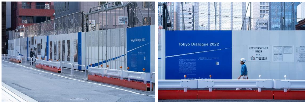
昨年度『Tokyo Dialogue 2022』の様子

企画：T3 PHOTO FESTIVAL TOKYO 実行委員会、戸田建設株式会社