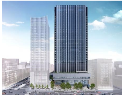
TODA BUILDING 外観

戸田建設は、京橋一丁目で本社建替えを含む大規模開発を進めており、2024年に「TODA BUILDING」を竣工し街区が生まれ変わります。都市再生特別地区、土地区画整理事業などの開発制度を活用し、建物低層部に京橋エリアの地域特性を活かした“新たな芸術文化の拠点”を形成します。上層部はテナント専用ビジネスサポート施設を有するオフィスフロアで構成し、来街者や働く人がアートに出会う場を創出します。