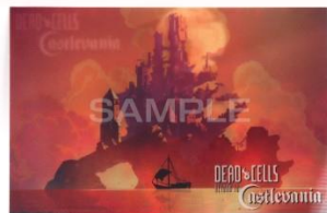
レンチキュラーカード