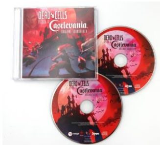
サウンドトラック