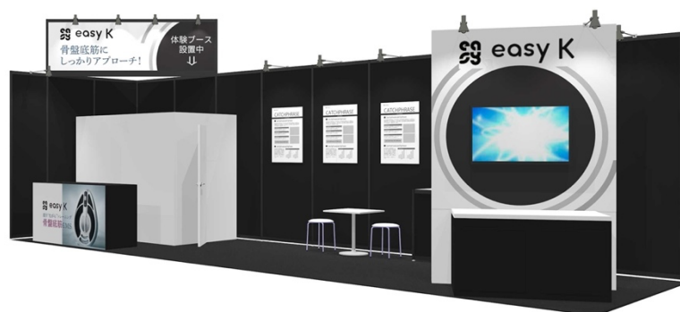
「easy-K」が体験できる当社ブース ※イメージ