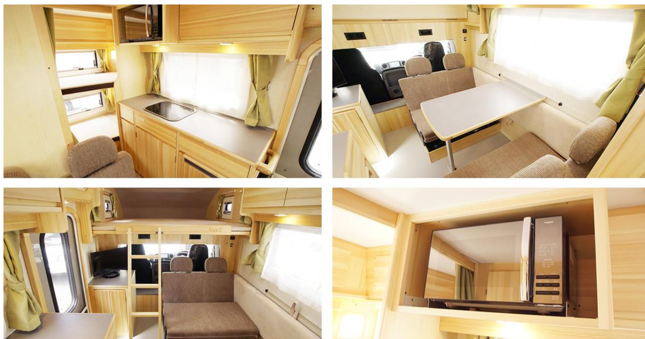
レンタルキャンピングカー「アンソニー」内観

◇利用料金はこちら : https://japan-crc.com/aomori/price-plan