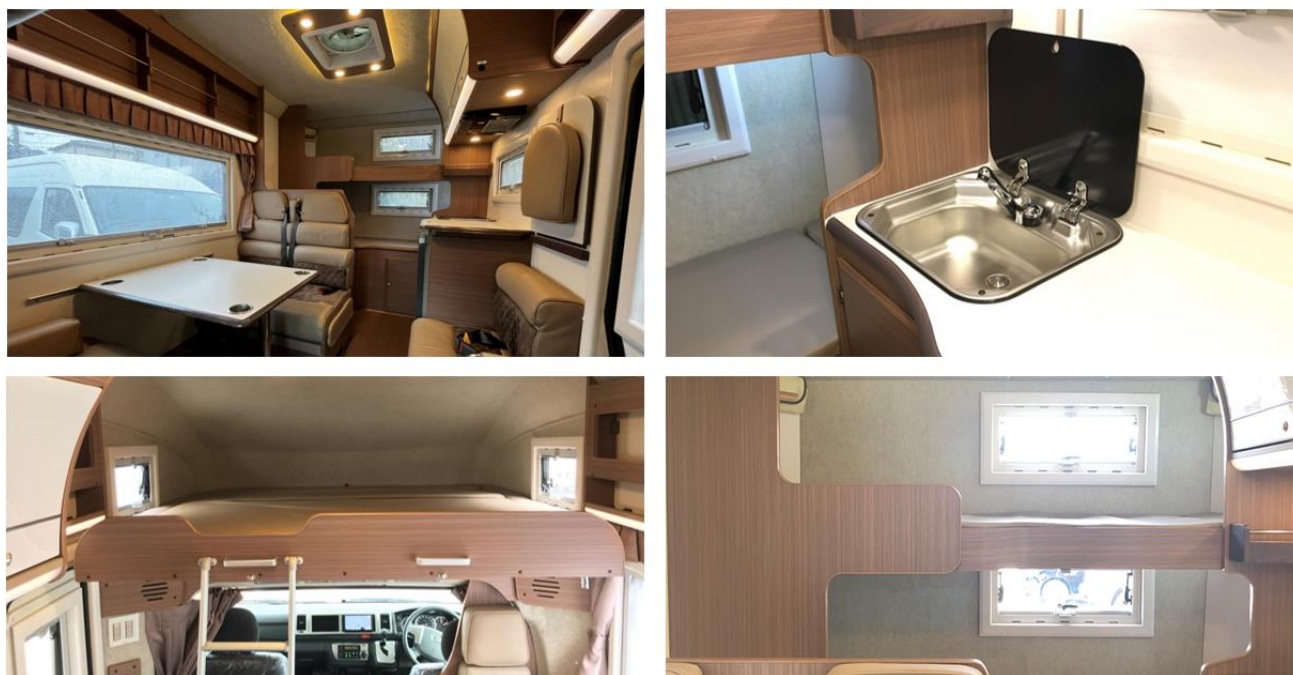
レンタルキャンピングカー「ロビンソン 771」内観