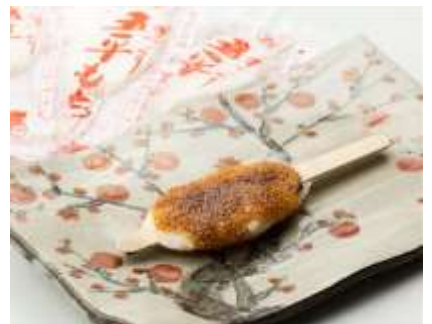
五平もち3本ギフト