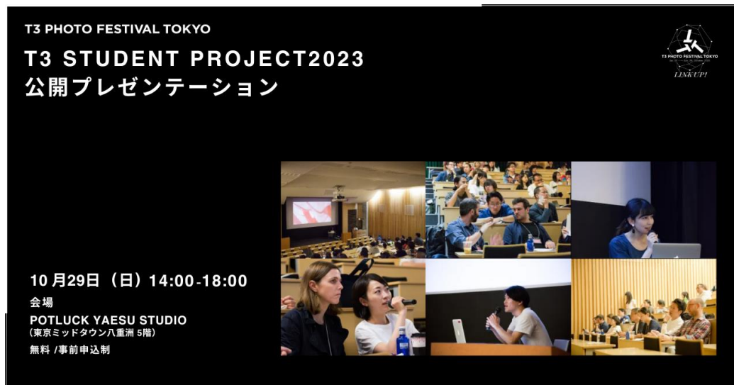
『T3 STUDENT PROJECT 2023 公開プレゼンテーション』告知用バナー

一般社団法人 TOKYO INSTITUTE of PHOTOGRAPHY（東京都中央区）は、屋外型国際写真祭『T3 PHOTO FESTIVAL TOKYO 2023』を東京駅東側エリアにて、2023年10月7日（土）～29日（日）の期間、開催中です。なお、当写真祭のクライマックスイベントとして『T3 STUDENT PROJECT 2023 公開プレゼンテーション』が10月29日（日）に開催されることが決定しました。参加費は無料です。写真の未来を担う若き才能をぜひご覧ください。