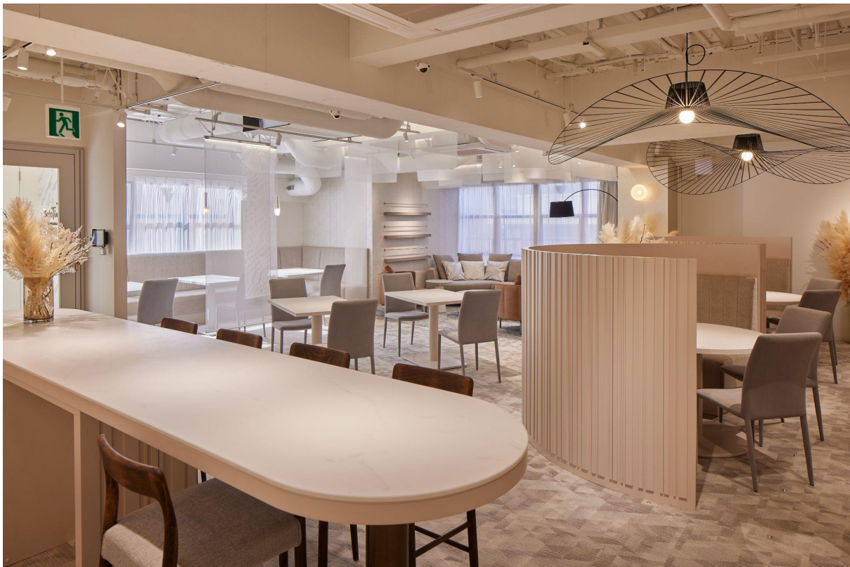
SoloTime 二子玉川店内写真