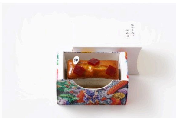
バニラ&イチゴのパウンドケーキ