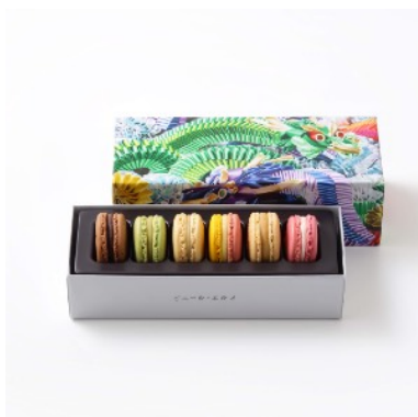
マカロン6個詰合わせ