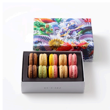
マカロン10個詰合わせ