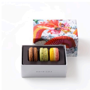
マカロン3個詰合わせ