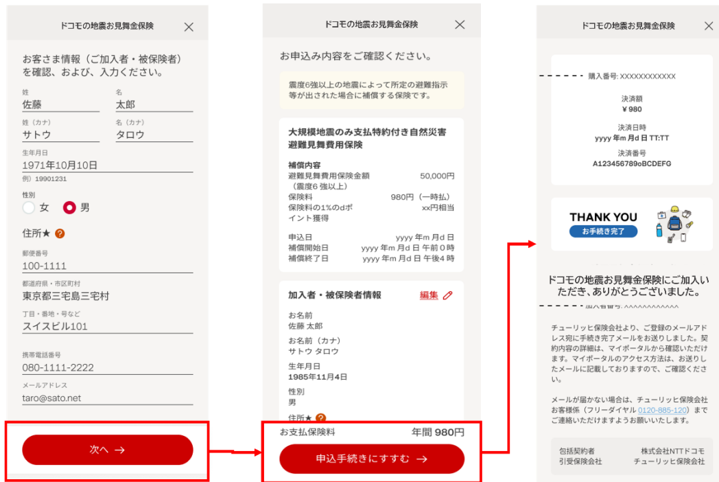
④お客さま情報の入力