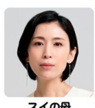
スイの母 雛形あきこ