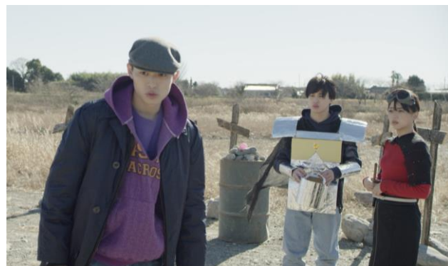
マコトたち素人集団が映画制作に挑む！の다가…