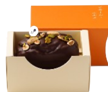
チョコレート&ナッツのパウンドケーキ