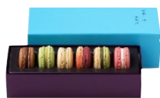
マカロン6個詰合わせ

「EYE OPENING LINER」からインスピレーションを得たバイカラーのボックスに、色とりどりのマカロンやケーキを詰め合わせました。マカロンは和素材「桜」や「黒ゴマ」「抹茶」を用いた『Made in ピエール・エルメ』ならではの味わいです。またチョコレートとナッツの風味と味わいのバランスが調和したパウンドケーキもバレンタインシーズン限定で登場します。