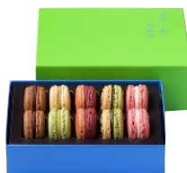
マカロン10個詰合わせ