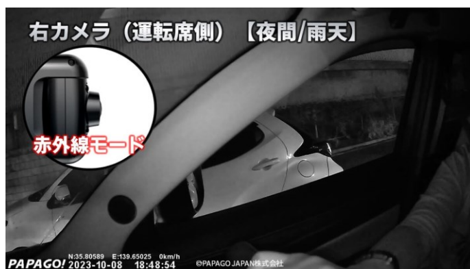
右カメラ（運転席側）