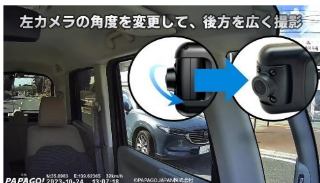
左カメラ（横 → 斜め後方ヘカメラ角度変更）