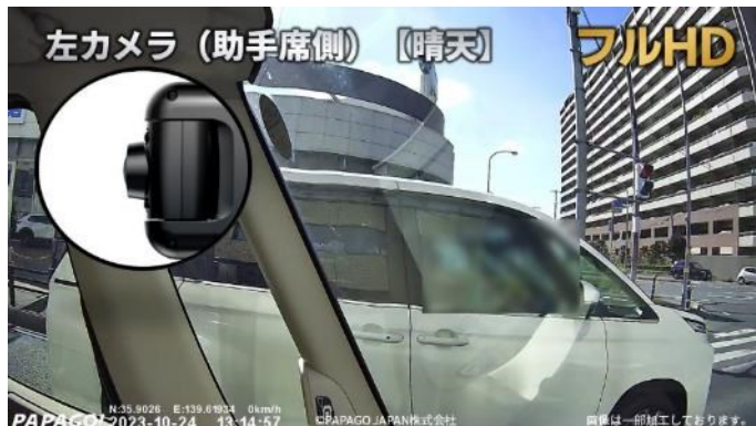
左カメラ（助手席側）