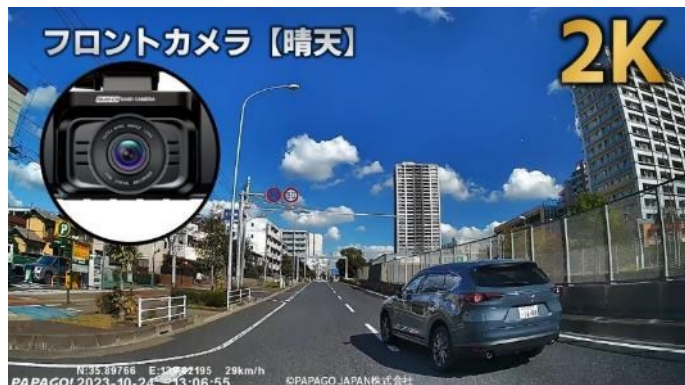
フロントカメラ（前方）