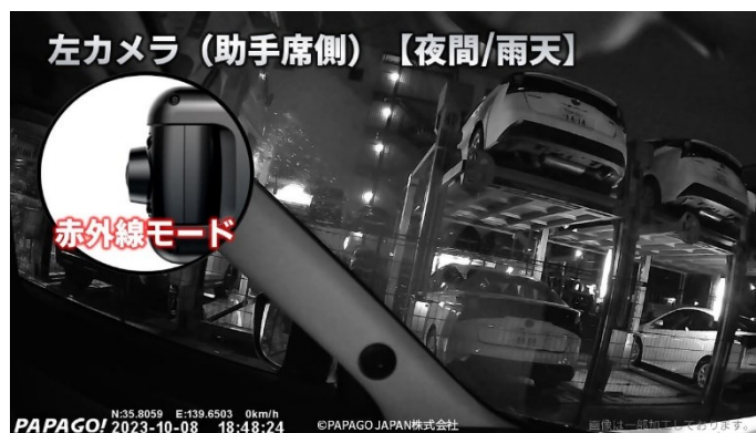
左カメラ（助手席側）