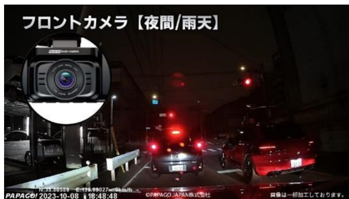
フロントカメラ（前方）