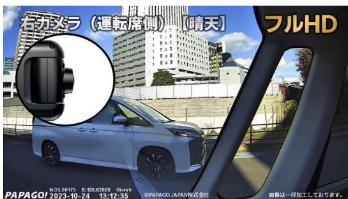
右カメラ（運転席側）