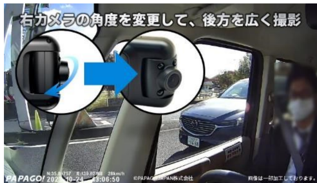
右カメラ（横 → 斜め後方ヘカメラ角度変更）