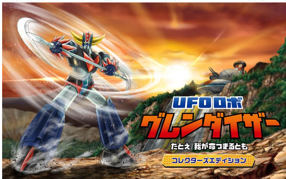
『UFO ロボ グレンダイザー：たとえ我が命つきるとも』 発売日決定トレーラー

株式会社 3goo（サングー）（本社：東京都渋谷区、代表取締役：デイクスタンゾ ニコラ）は本日、Endroad と Microids Studio Paris が開発し、世界中で熱狂的な人気を誇るマジンガーシリーズ第三作目である「UFO ロボ グレンダイザー」を完全ゲーム化した『UFO ロボ グレンダイザー：たとえ我が命つきるとも』を PlayStation®5、PlayStation®4（パッケージ版およびダウンロード版）で 2024 年 4 月 18 日に発売することを発表し、最新トレーラーを公開いたしました。ゲームとアニメ両方の設定資料が掲載されたアートブックなどを同梱するコレクターズエディションも同時発売いたします。本日より全国のゲームソフト販売店、オンラインストアにて予約受付を開始いたします。