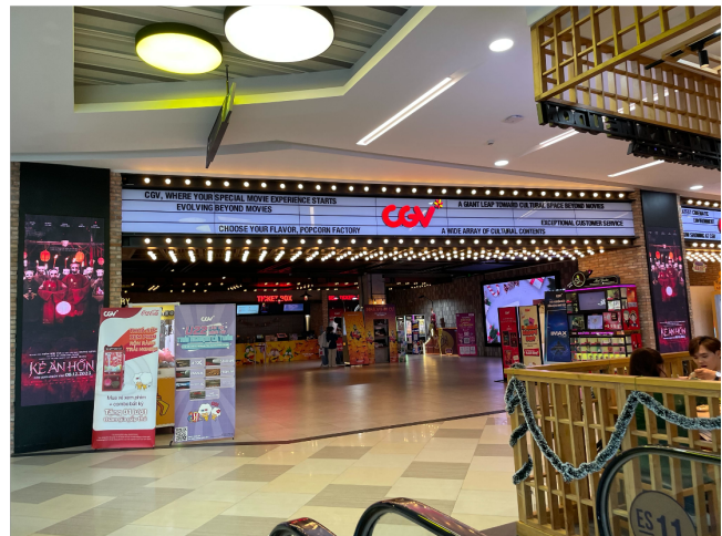
*左上から時計回りに「Lotte Mall」「Lotte Cinema」「CGV」「BHD Cineplex」