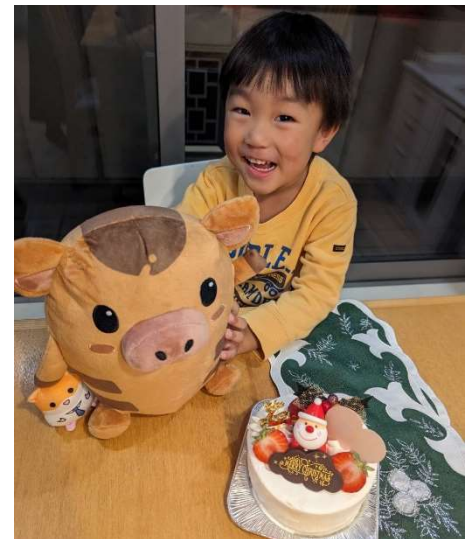
抽選で社員、派遣スタッフにクリスマスケーキをプレゼント

他社では派遣スタッフにまでこうした取り組みを行う人材派遣会社は少ないことから、スタッフからの評判も良く、このような取り組みを通じて「他の派遣会社とは違ってこの派遣会社においてよかったな」と思ってもらえる機会を作りたいと考えています。