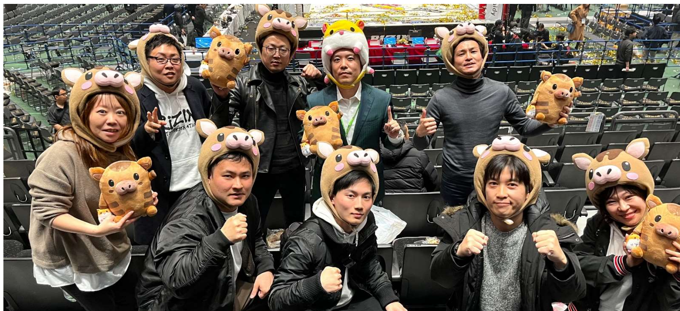
派遣スタッフにも観戦チケットを提供、スポンサーも務める RIZIN 観戦ツアーの様子

これらの背景には、 社員、派遣スタッフ、派遣先との絆を重視し、「道徳的資本主義」を追求する当社の企業理念 があります。コロナ禍での返金対応に加え、派遣スタッフにも日頃から感謝の気持ちをカタチにすることでエンゲージメント向上を図り、スタッフの定着率アップにも繋がっています。ここでは、当社の道徳的資本主義に関するエピソードを交え、解説します。