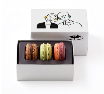
マカロン 3個詰合わせ ¥2,052

人気の「チョコレート」や限定フレーバーの「桜」を含む3種類のマカロンを、アーティスト長場雄さんによる2人が寄り添いあう様子が描かれた限定ボックスに詰め合わせました。心躍るかわいらしいボックスと上質なマカロンは喜ばれること間違いなしです。