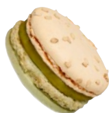
マカロン 抹茶&黒ゴマ