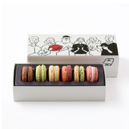
マカロン 6個詰合わせ ¥3,294

人気の「チョコレート」や限定フレーバーの「桜」「抹茶&黒ゴマ」などを含む6種類のマカロンを詰め合わせました。アーティスト長場雄さんによるあたたかみあふれるアートワークには“感謝の気持ち”や“頑張った自分への労い”などのメッセージが込められています。大切な人への贈りものやいつも頑張っている自分へのご褒美に。心弾む時間を過ごしましょう。