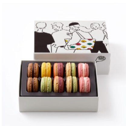
マカロン 10個詰合わせ ¥4,482

定番の「チョコレート」や限定フレーバーの「桜」「抹茶&黒ゴマ」など、色とりどりのマカロン6種類を詰め合わせました。アーティスト長場雄さんによる心晴れやかにこれからの挑戦と一緒に応援してくれるようなアートワークは、心機一転新しいステージへ向かう方へのプレゼントにもぴったりです。