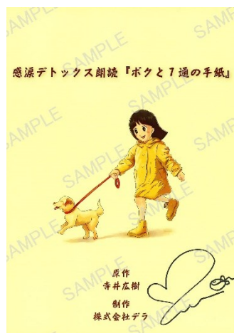
「石川由依直筆サイン入り台本」イメージ