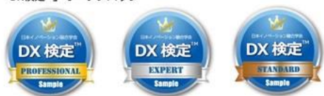
「DXビジネス検定™」オープンバッジ