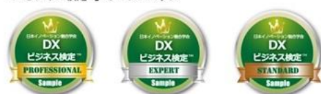
▲オープンバッジ サンプルイメージ