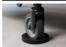
OP/RST-S ラバーストッパーSサイズ 各シャリエ1つずつ標準同梱