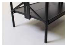
OP/CW-H シャリエワゴン/ハイ脚 キャスターを付けずに棚としても使用可能。ハイトタイプには標準付属