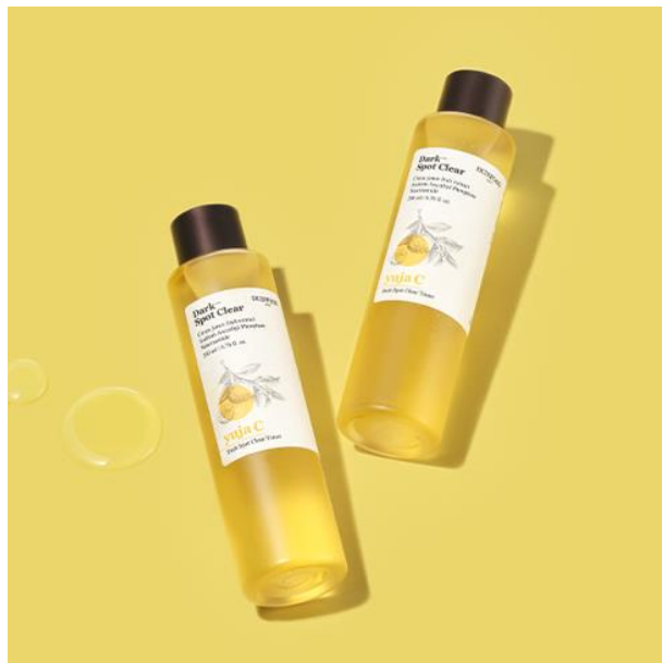
（写真：ゆず C ダークスポット クリア トナー）