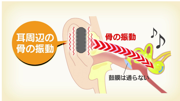
※音の伝わり方のイメージ

骨伝導イヤホンは鼓膜の代わりに、こめかみ周辺の骨を震わせることによって、耳の穴を塞がずに音を伝えるイヤホンです。リスモアは通常のイヤホンと違い、耳にかけて使います。オープンイヤー式イヤホンなので、周囲の音が遮断されずに違和感なく聞こえ、そのまま会話をすることも可能です。耳の穴を塞がないことで耳が疲れにくく圧迫感ありません。