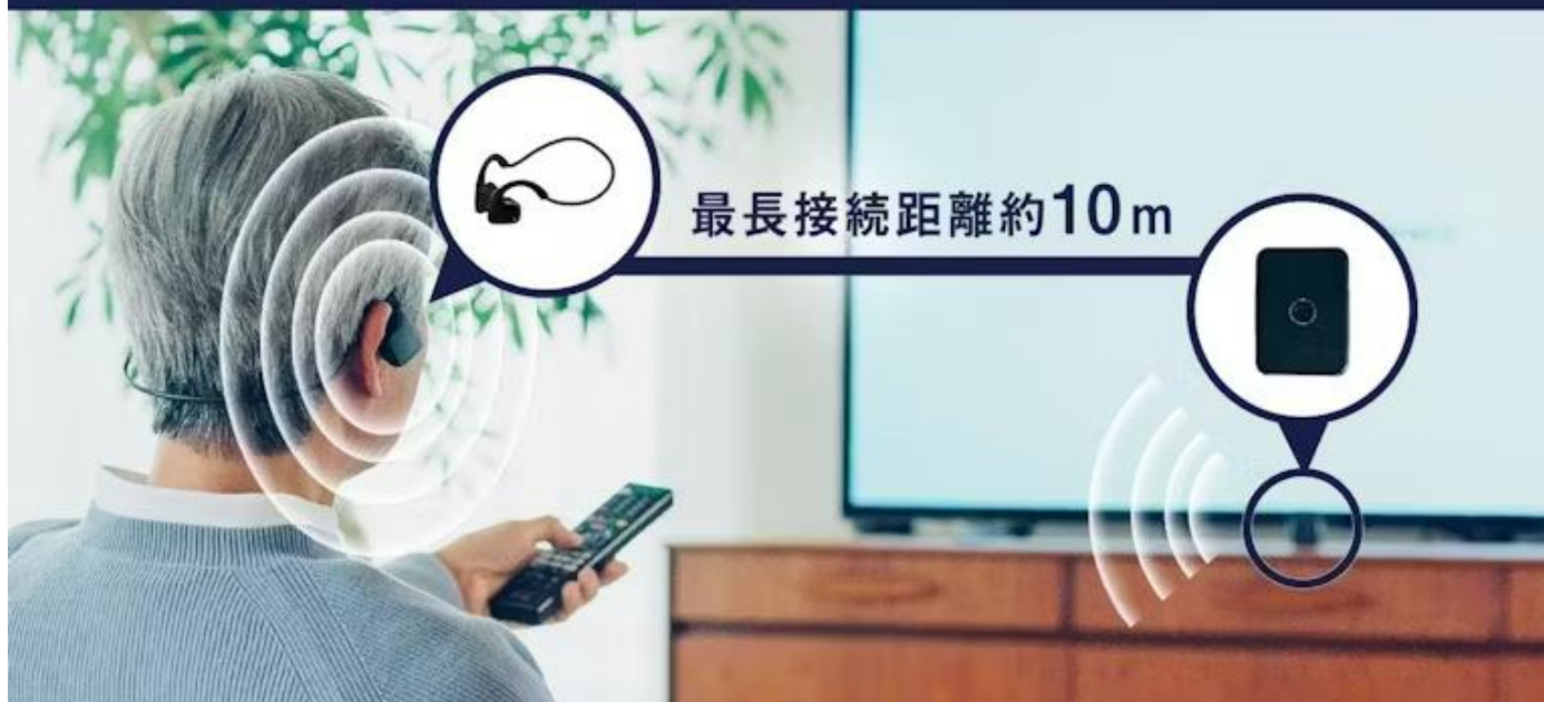
※リスモア使用時のイメージ