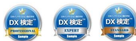
▲オープンバッジ画像サンプル

レベル認定された方には、ブロックチェーン技術を使ったスキルのデジタル証明・認証である「オープンバッジ」(2 年間有効)が付与されます。社内認定や、名刺等にも活用可能となります。