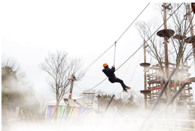
▲足元が見えないスリル満点な雲海アスレチック

春の訪れを楽しめる絶景＆美食の淡路旅に、スリル満点のアスレチック体験が合わされば完璧なプランの出来上がり！今年の春は友達と一緒に雲海アスレチックに挑戦して、“アクティブ旅”を満喫しよう！