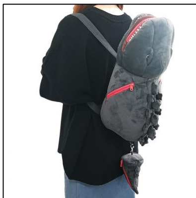
▲ここでしか手に入らないゴジラ背負いリュック