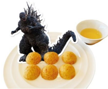
▲ゴジラ-1.0 明石焼き／1,000 円（税込）

「ゴジラ迎撃作戦」ではゴジラグッズも充実！ニジゲンノモリでしか買えないオリジナルグッズも多数展開しております。かっこいい帽子や可愛いカチューシャを着けてアトラクションを体験すれば、より一層ゴジラの世界観に入り込めます。また、グラスやフィギュアやお菓子など、お土産の購入にもご利用ください！」