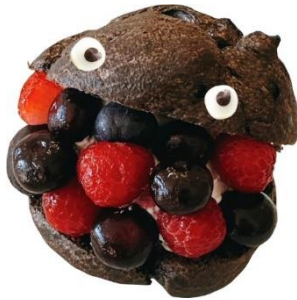
▲ゴジラ-1.0 シュークリーム／650 円（税込）

日本国内のみならず、世界で大ヒットを記録する新たなゴジラ映画の金字塔『ゴジラ-1.0』の世界を、全身で楽しむことができます。コラボフードを食べてゴジラ迎撃作戦を満喫しよう！