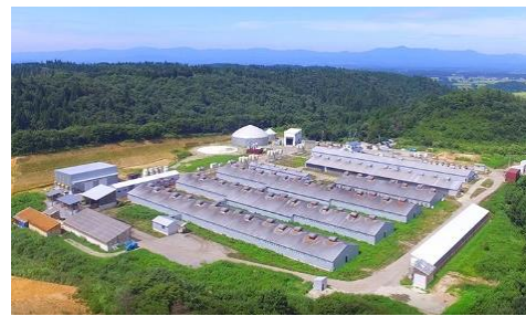
米の娘(こ)ファーム