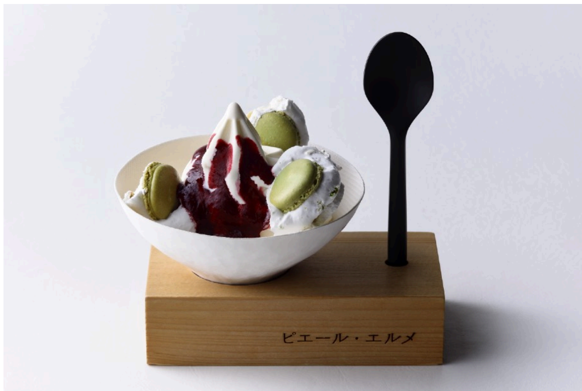
ミックスベリーのソフトクリーム（ソース増量） ※7月3日（水）限定