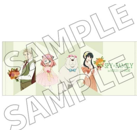
▲フェイスタオル／1,980 円（税込）