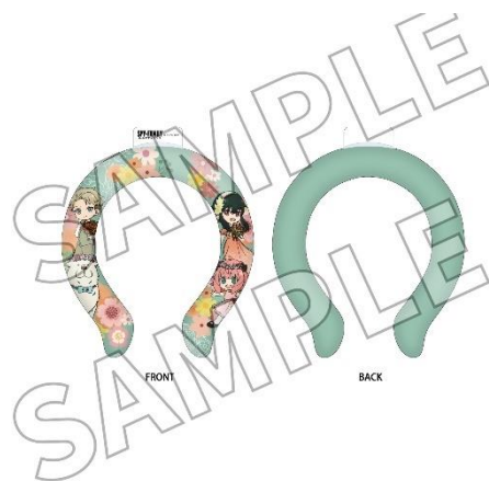
▲ネッククーラー／2,200 円（税込）

兵庫県立淡路島公園アニメパーク「ニジゲンノモリ」にて開催されている期間限定コラボイベント『SPY×FAMILY in ニジゲンノモリ〜ドキドキめいろとフラワーパーク〜』の第 2 弾コラボグッズ全 23 種が 6 月 8 日（土）より販売開始となります。今回は、全長 47 cm のとっても可愛いボンドのぬいぐるみティッシュケースをはじめ、オリジナルデザインのフォージャー家が描き下ろされた厚手レジャーシートやネッククーラー、アーニャとボンドそれぞれをイメージしたフード付きタオルやレインポンチョなど、夏のお出かけにピッタリのオリジナルグッズが多数登場です！さらに、オリジナルグッズの購入 2,000 円ごとにオリジナル特典カードをプレゼントいたします。可愛くてつつい手にとってしまう『SPY×FAMILY in ニジゲンノモリ』のオリジナルグッズを手に入れ、最高に楽しい夏をニジゲンノモリで過ごそう！