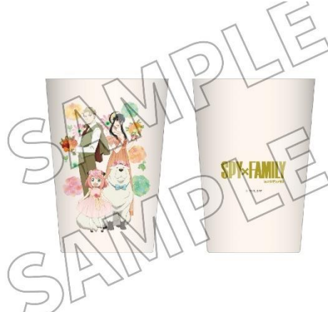
▲2WAY タンブラー／2,530 円（税込）