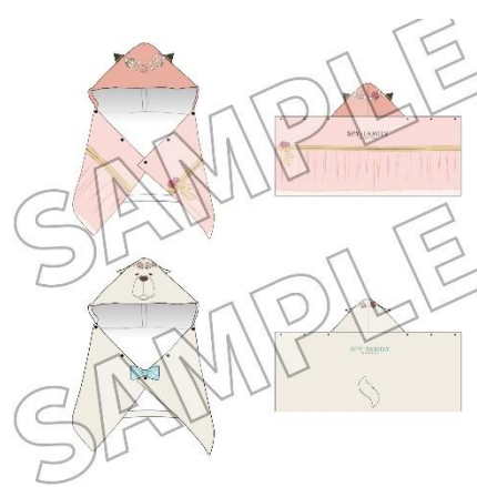
▲フード付きタオル／5,980 円（税込）