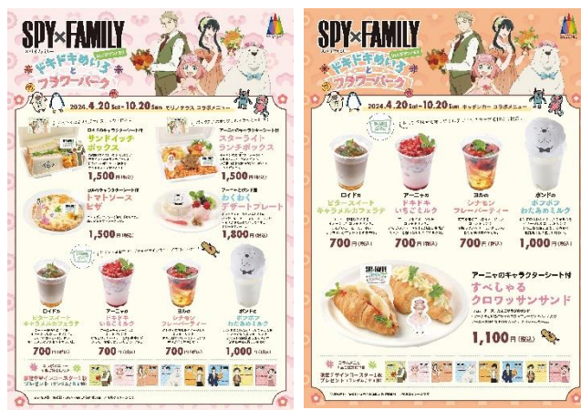
▲コラボフード メニュー