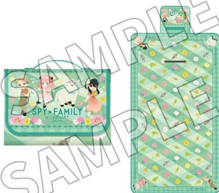
▲厚手レジャーシート／4,950 円（税込）