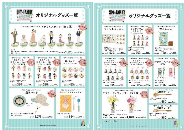
▲第 1 弾コラボグッズ一覧

また、レストラン「モリノテラス」・「SPY×FAMILY in ニジゲンノモリ」エリア内キッチンカーにて、キャラクターをモチーフにした全 10 品のコラボフードを販売いたします。イーデン校の“星（ステラ）”をイメージしたハンバーグがメインの「スターライトランチボックス」や、ポンドとアーニャ風の飾りが可愛い「わくわくデザートプレート」に加え、家族や友だちとシェアしながら、イベントエリア近くの芝生広場でピクニック気分を楽しむことができる「ピクニックランチセット」も提供いたします。コラボフード 1 品購入ごとに、限定デザインのオリジナルコースターも手に入れることができます。