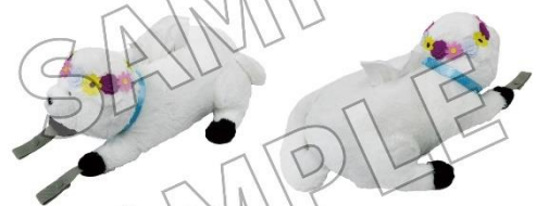
▲ボンドのぬいぐるみティッシュケース／4,180 円（税込）

『SPY×FAMILY in ニジゲンノモリ〜ドキドキめいろとフラワーパーク〜』の最新イベント情報をお届けします。