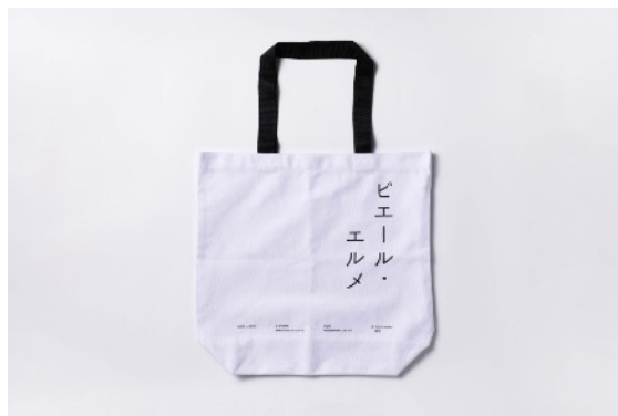
キャンバスバッグ 2,750円

広島県福山の世界に誇るデニム生地製造メーカー「カイハラ」のデニムを使用し、日本有数のうちわどころ、香川県丸亀でつくられたオリジナルうちわです。