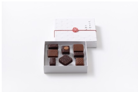
チョコレート8個詰合わせ 4,320円

エクアドル産チョコレートガナッシュ、ビターチョコレートコーティング/ゴマ入りブラリネ、ゴマ入りヌガティース、ミルクチョコレートコーティング/ピンクグレープフルーツ風味ビターチョコレートガナッシュ、ピンクグレープフルーツ風味のゼリー、ビターチョコレートコーティング/パッションフルーツ風味ミルクチョコレートガナッシュ、ミルクチョコレートコーティング/ローストアマランサスシード入りベリーズ産チョコレートガナッシュ、ビターチョコレートコーティング/粗く砕いたヘーゼルナッツブラリネ、マジパン、ビターチョコレートコーティング/粗く砕いたシベリア杉の実入りブラリネ、ミルクチョコレートコーティング/ロングペッパー風味ガナッシュ、ビターチョコレートコーティング