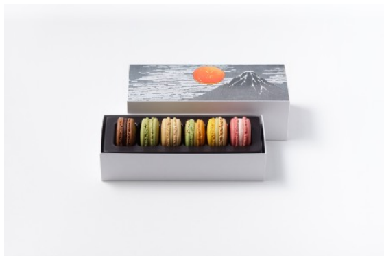
マカロン6個詰合わせ 3,078円