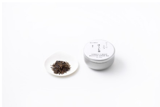
四万十川源流茶 ほうじ茶 1,404円

自然豊かな小豆島で伝統的な手延べそうめんを真摯に続ける「真砂喜之助製麺所」。ごま油を使い、小豆島の天日に晒されて造られたそうめんは、抜群のコシとつるりとした喉越しの良さが特徴です。