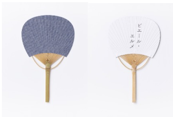
デニムのうちわ 2,200円

日本最後の清流と呼ばれる高知県四万十川の源流点に位置する津野町で丹精込めて育てられた上級煎茶を自社工場職人が焙煎した拘りのほうじ茶です。香ばしい香りが口の中いっぱいに広がり食後のお口直しやホッと一息つきたいときにお勧めです。