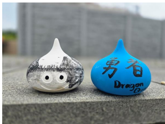
▲世界にひとつ自分だけのオリジナルスライム