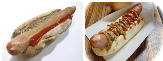
燾やの七山ドッグとナンドッグ