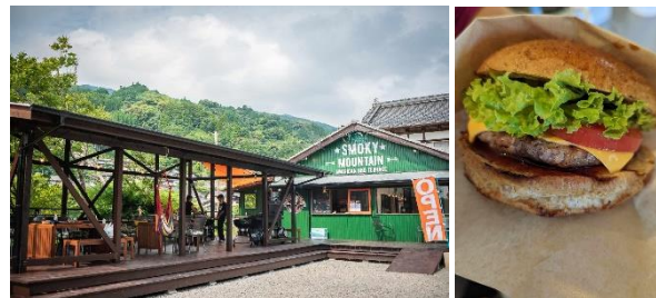
スモーキーマウンテンのハンバーガー