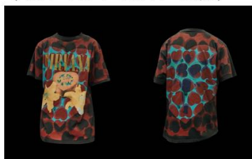
・NIRVANA Heart Shaped Box (ニルヴァーナ ハート・シェイプド・ボックス)