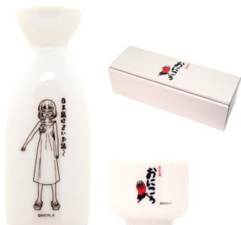
とっくり&おちょこ