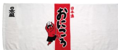
今治フェイスタオル