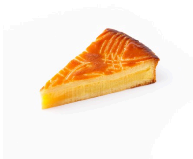
サツマイモのガトーバスク