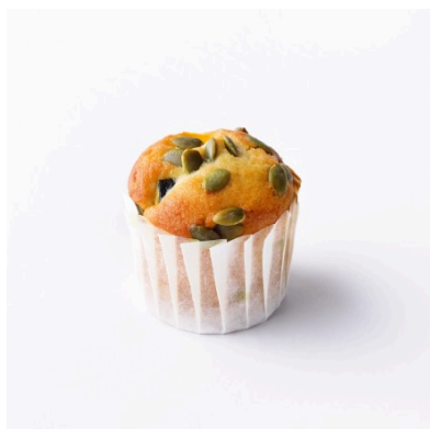
カボチャのマフィン

しっとり甘みのある福井県産「とみつ金時」と、濃厚な自家製カスタードをたっぷりを使用したガトーバスク。なめらかな口当たりと香ばしい生地 of 風味を楽しめる、秋にぴったりの逸品です。