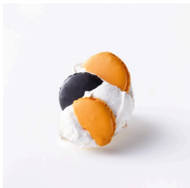
オレンジのメレンゲ

京都発の老舗コーヒーロースター『小川珈琲』の上質なエスプレッソが生み出す香り高い味わいと栗のやさしい香りと甘みが秋にぴったりの季節限定のまるやかなカフェラテです。