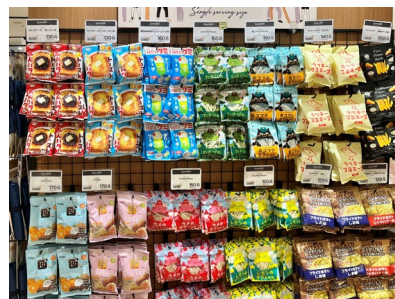
食べきりサイズのお菓子