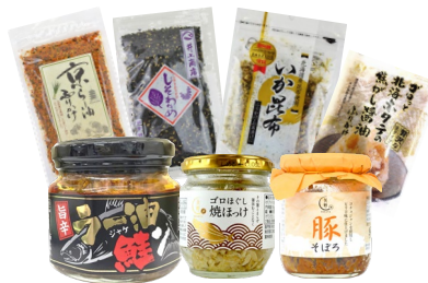
ご飯のおとも“めしとも”