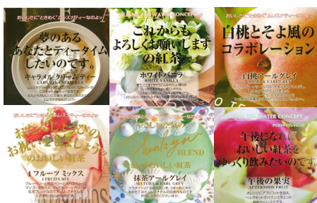
ギフトにもおすすめ ムレスナティー