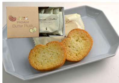
新商品 ふたこラスク