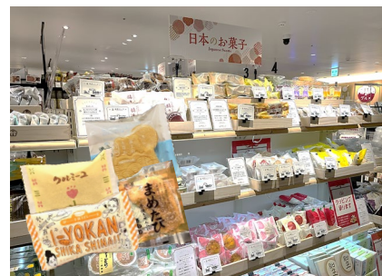
諸国銘菓コーナー