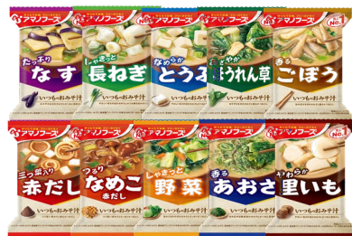
アマノフーズお味噌汁40個セット