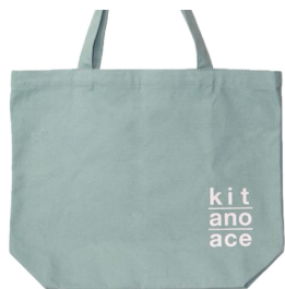
オリジナルエコバック プレゼントキャンペーン ※先着150名様

リニューアルオープンを記念した企画も実施予定です。リニューアルオープン初日の9月13日（金）から、税抜3,000円以上ご購入の上、北野エース公式LINEをお友達登録のお客様にはオリジナルエコバッグをプレゼント。（※先着150名様）さらに、お得な“お楽しみHappy Bag”としてキュートなどぶつパンセットやアマノフーズお味噌汁40個セットなどを販売いたします。※数量限定品のため無くなり次第終了とさせていただきます。