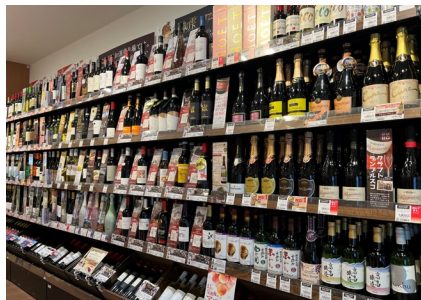
日本酒・ワインなど酒類