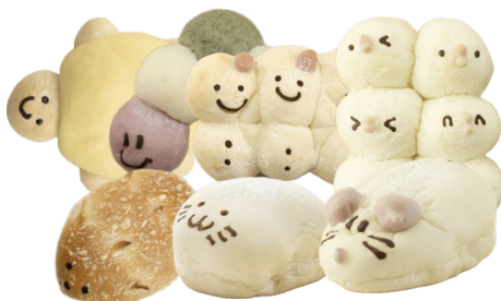
どうぶつパンセット