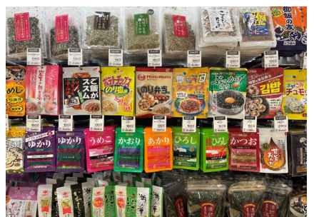
ふりかけコーナー