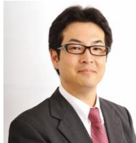
河合 敦 氏

テレビ番組「歴史探偵」でもおなじみの河合敦氏が、近年数多く登場している関ケ原合戦の新説をふまえながら、天下分け目の戦いをわかりやすく解説します。