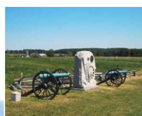
ゲティスバーグ古戦場