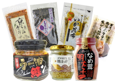
ご飯のおとも“めしとも”