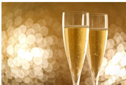
スパークリングワインくじ