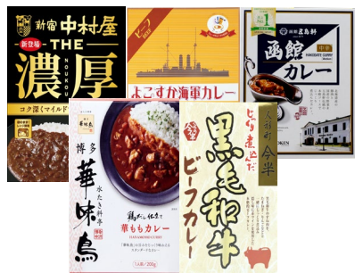
北野エース おすすめカレーセット

10月11日（金）～10月14日（月・祝）の期間、オープンを記念して「お楽しみHappy Bag」や「詰め放題企画」を予定しています。セットでお得な「北野エース おすすめカレーセット」や、何が出るかお楽しみの「スパークリングワインくじ」のほか、アマノフーズフリーズドライお味噌汁の詰め放題、チーズの詰め放題など、期間限定のお得な企画を予定しています。