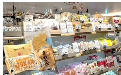
諸国銘菓コーナー