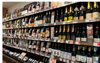
日本酒・ワインなど酒類