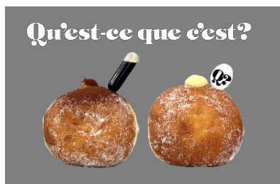
Qu'est-ce que c'est? 生ドーナツ