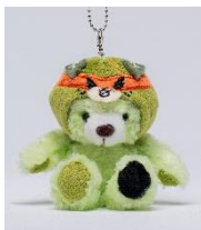
マスコット ST 【ダークみきゃん】