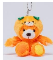
マスコット ST 【みきゃん】