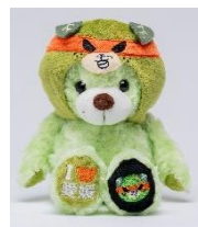
ぬいぐるみ S 【ダークみきゃん】