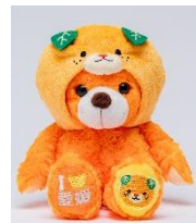
ぬいぐるみ S 【みきゃん】