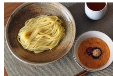
「めんたい煮こみつけ麺」調理イメージ