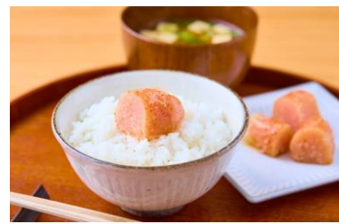
「めんたい重の昆布巻き明太子」調理イメージ