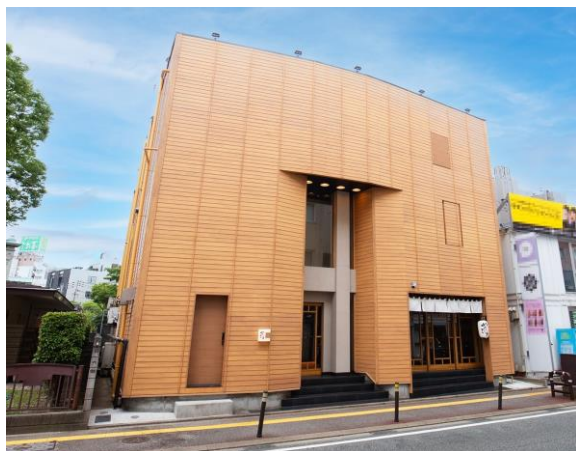
「元祖博多めんたい重 西中洲」外観

元祖博多めんたい重株式会社が運営する、明太子料理専門店「元祖博多めんたい重（所在地:福岡市中央区）」は、2024年10月11日（金）～2025年3月31日（月）までの期間限定で、福岡空港国内線ターミナル「JAL PLAZA 6番ゲートショップ」にて、おみやげ商品を販売いたします。日頃より贈答品としても人気の「めんたい重の昆布巻き明太子」や、常温商品の「めんたい煮こみつけ麺」「西中洲ドレッシング」など、明太子料理専門店ならではの商品を取り揃えております。地元福岡の皆様の手みやげや、旅行の思い出としてご利用いただけるよう、心を込めてお作りいたします。