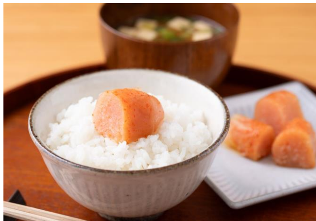
「めんたい重の昆布巻き明太子」調理イメージ