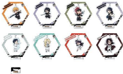
▲ゆらゆらアクリルスタンド（全 8 種）／660 円（税込）

兵庫県立淡路島公園アニメパーク「ニジゲンノモリ」で開催されている期間限定コラボイベント『BLEACH 千年血戦篇』×ニジゲンノモリ コラボイベントでは、イベント会場でしか購入ができなかった第 1 弾コラボグッズ全 34 アイテムを 11 月 1 日（金）10 時よりニジゲンノモリ公式オンラインショップ（ https://shop.nijigennomori.com/ ）にて販売開始いたします。黒崎一護、朽木ルキア、阿散井恋次など人気キャラクターたちがデザインされた「ゆらゆらアクリルスタンド」や護廷十三隊の隊花が刻まれた「サーモタンブラー」など、ファン必見のオリジナルグッズが目白押し。直接ニジゲンノモリに来場することが難しい方も、購入可能な EC サイトでは、10,000 円以上をお買い上げの方には送料無料などの特典も！ついにはじまった TV アニメ『BLEACH 千年血戦篇-相剋譚-』も好評放送中！オリジナルグッズを手し、死神たちの戦いを見守ろう！