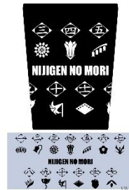
▲サーモタンブラー／2,200 円（税込）