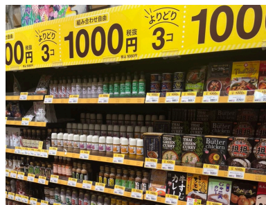
よりどり3点コーナー