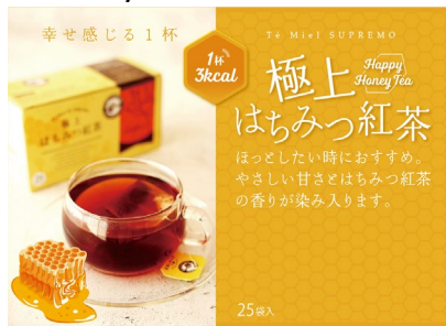
極上はちみつ紅茶