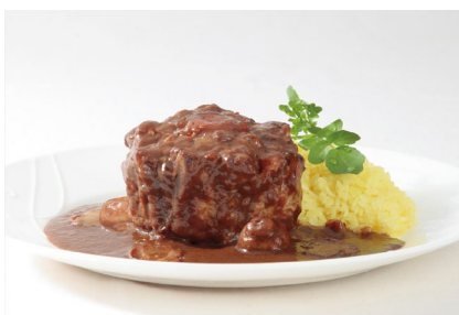
牛テールカレー Gorotto 2,160円（税込）